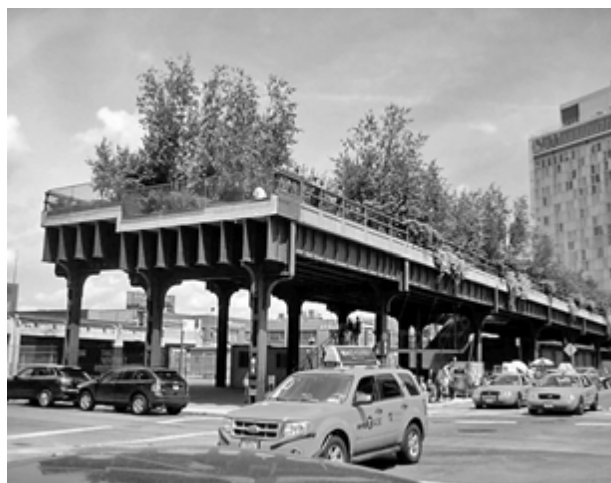
1. High Line w Nowym Jorku.

W 2003 roku, w celu wyboru najlepszej koncepcji projektowej, ogłoszono konkurs architektoniczny z inicjatywy stowarzyszenia Friends of the High Line . 4 Spośród wielu zgłoszonych prac konkursowych