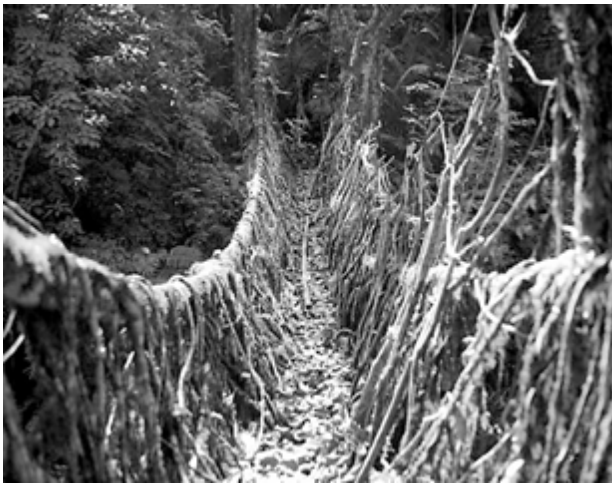
6. „Żywy most”. 6. Living root bridge.