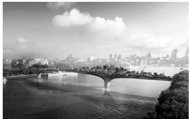
4. Wizualizacja mostu-ogrodu.

Usytuowany w sercu metropolii – pomiędzy dwoma mostami: Waterloo i Blackfriars – zapewni integrację północnej i południowej części miasta. Koncepcja Garden Bridge, autorstwa brytyjskiego architekta Thomasa Heatherwicka 7 , zakłada budowę