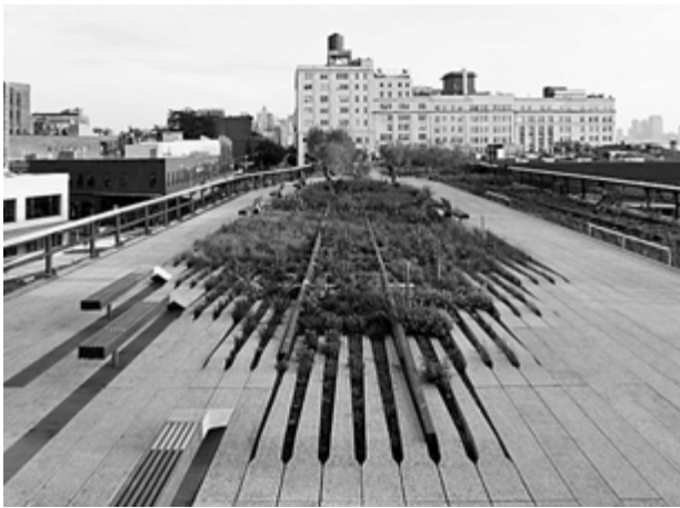
2. High Line w Nowym Jorku.