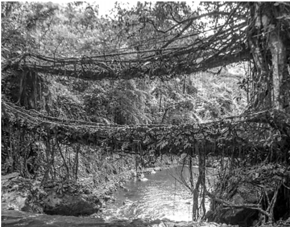
8. Umshiang Double-Decker Root Bridge w Cherrapunji.