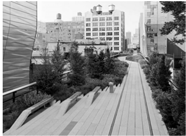
3. High Line w Nowym Jorku.