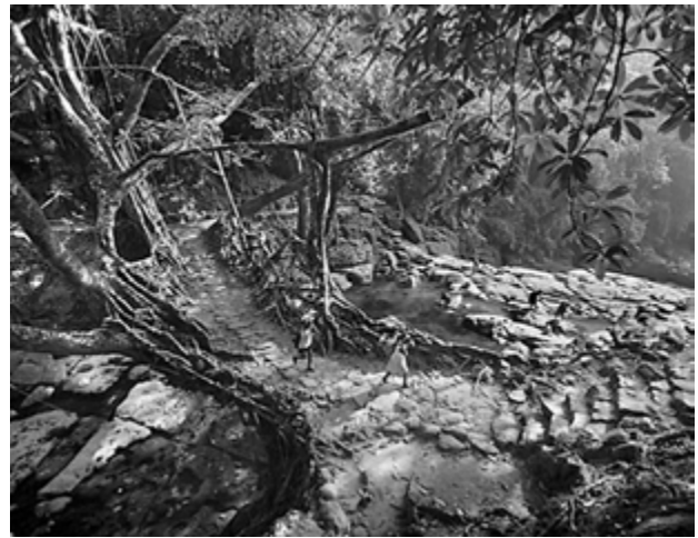
7. Konstrukcja „żywego mostu” uzupełniona kamieniami.