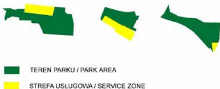
Il. 4. Przykłady usytuowania strefy usługowej przy granicy parków (Opracowanie auterek)

Parki osiedlowe z kolei tworzone często z dużym opóźnieniem w stosunku do zabudowy. Można podzielić je na dwie kategorie: położone wewnątrz lub w strefie brzegowej osiedla. Pierwsze charakteryzują się dość nieregularną linią granicy. Wcinając się w przestrzeń między budynkami tworzą plany rozgałęzione (Il. 3). W rzeczywistości ich granica nie jest wyraźnie zaznaczona w terenie. Obszary te przenikają się z zielenią osiedlową. Natomiast obiekty położone na skraju osiedla mają przeważnie wydłużony zarys, przylegają z co najmniej jednej strony do zabudowy mieszkalnej, oraz z co najmniej jednej strony do ulicy (często o dużym natężeniu ruchu). Parki osiedlowe pełnią też nieco inną funkcję w stosunku do tych, położonych bliżej centrum miasta. Mają one służyć przede wszystkim tutejszym mieszkańcom, tworzyć przyjazną przestrzeń do wypoczynku na świeżym powietrzu. Oferują odpowiednie atrakcje dla osób w różnym wieku (place zabaw dla dzieci, siłownie dla dorosłych, alejki spacerowe, ścieżki do jazdy na rolkach czy rowerach itd. itp.). Kompozycja zieleni jest zróżnicowana, z przewagą powierzchni trawnikowych. Nie brakuje jednak miejsc ocienionych, dających możliwość schronienia przed słońcem. Wprowadzane są również urozmaicone obsadzenia z krzewów. Stosunkowo niewiele (choć coraz więcej) wprowadza się na tych obszarach roślin kwiatowych.