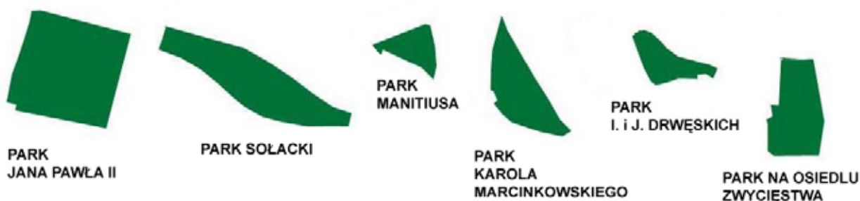
Il. 2. Parki na planach zwartych (Opracowanie auterek) Ill. 2. Parks on the compact plans (The author's compilation)

W wyniku przeprowadzonych badań stworzono zestawienie i pogrupowano parki według charakteryzujących je cech. Jednym z wyróżników jest lokalizacja. Okazuje się, że parki śródmiejskie planowano jako zwarte oraz z wyrównaną linią granic (Il. 2). Obecnie mają bardziej dojrzałą formę (co jest oczywiście zrozumiałe z uwagi na wcześniejszy czas powstania). Pełnią nie tylko funkcję wypoczynkową, ale też reprezentacyjną. Korzystają z nich zarówno okoliczni mieszkańcy, jak też osoby przybyłe do centrum miasta z innych dzielnic, a nawet spoza Poznania. Parki te z reguły są lepiej wkomponowane w otoczenie – powstawały na terenach z góry na ten cel przeznaczonych, a nie wtórnym, poprzez „wtłaczanie” w istniejącą zabudowę. Niektóre założenia parkowe śródmiejskie zostały z czasem powiększone, przez dołączenie przyległych zieleńców – w takim wypadku ich linia graniczna bywa bardziej zróżnicowana.