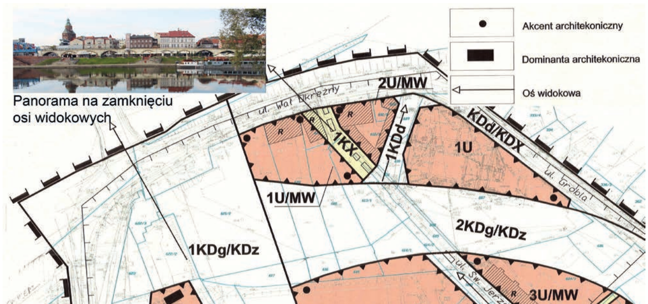
Il. 3 Fragment rysunku miejscowego planu zagospodarowania przestrzennego. Gorzów WLKP

III. 2 Part of local land development plan.