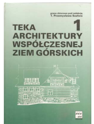
Il. 5. okładki książek T.P. Szafera oraz okładka Teki Ziem Górskich 1. red. T.P. Szafer.