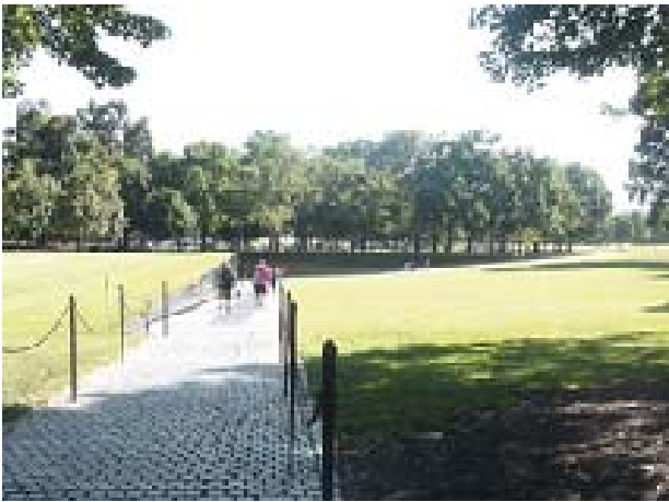
Il. 1. Vietnam Veteran Memorial. Fot. Karolina Porada, 2016