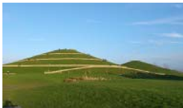
Il. 3. Kopce ziemne w Northala Fields.

Funkcję bariery akustycznej pełnią również ziemne formy zlokalizowane w parku Buitenschot w Amsterdamie – w tym wypadku teren zielony zo-