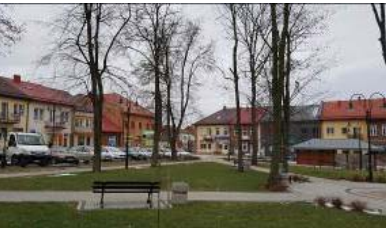
Il. 8. Widok na fragment rynku w Wiślicy – narożnik północno-zachodni.