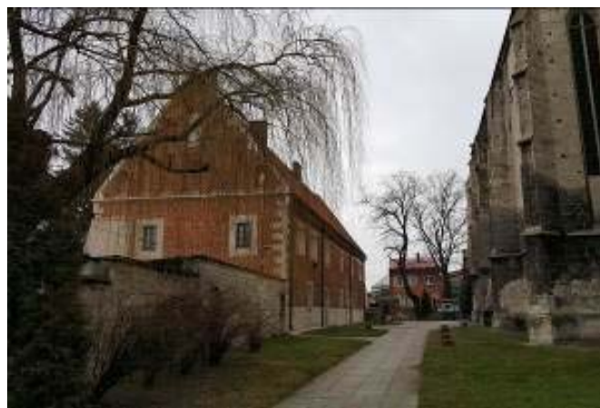
Il. 11. Widok na dom Długosza w Wiślicy obecnie. Fot. Autorzy, 2016.

Ill. 10. View of the House of Długosz in the 1960s. Photo: [in:] Archive of the Chair of History of Architecture, Urban Planning and Popular Art, Faculty of Architecture, Cracow University of Technology (further: KHAUiSzP WA PK), s.v.