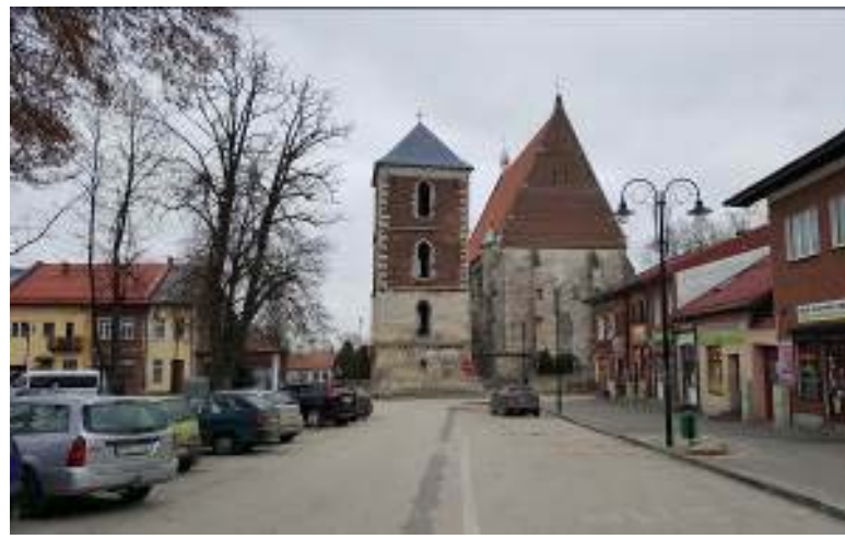
Il.3. Widok na kolegiatę w Wiślicy od strony rynku obecnie.

Ill. 3. View of the collegiate church in Wiślica from the market square nowadays.