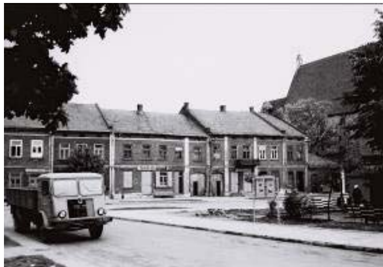
Il. 6. Widok na fragment rynku w Wiślicy w latach 60. XX wieku.

Ill. 6. View of a fragment of the market square in Wiślica in the 1960s.