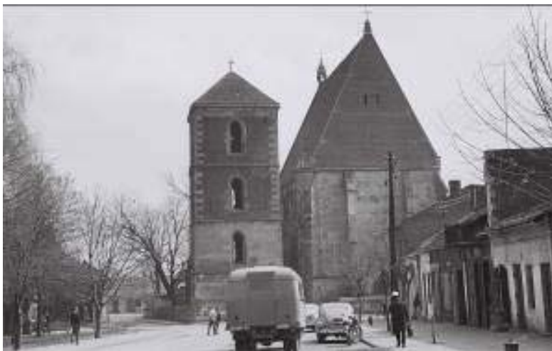
Il.2. Widok na kolegiatę w Wiślicy od strony rynku w latach 60-tych XX wieku.

Ill. 2. View of the collegiate church in Wiślica from the market square in the 1960s.