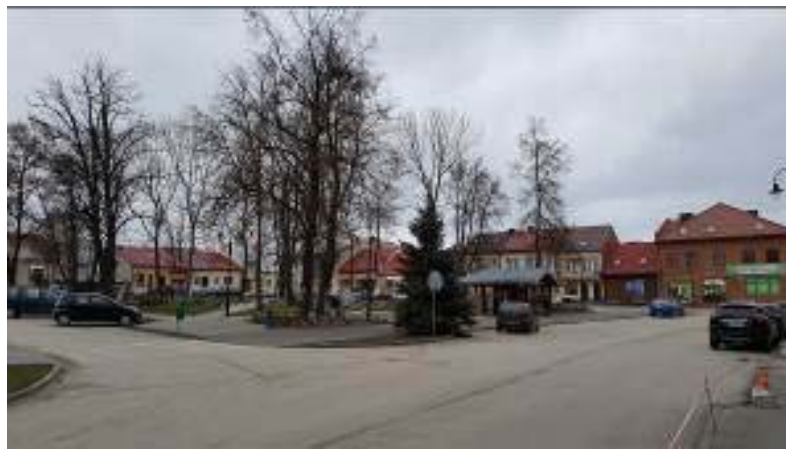
Il. 9. Widok na fragment rynku w Wiślicy – narożnik południowo-zachodni.

Wracając do problematyki układu urbanistycznego Wiślicy, który wytyczono w wieku XIII, należy dodać, że centrum miasta zajął rynek o wymiarach