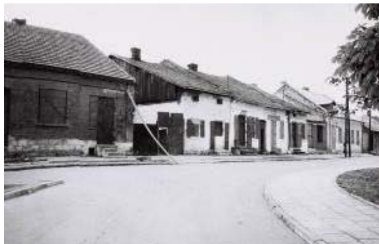
Il. 7. Widok na fragment rynku w Wiślicy w latach 60-tych XX wieku.

Ill. 6. View of a fragment of the market square in Wiślica in the 1960s.