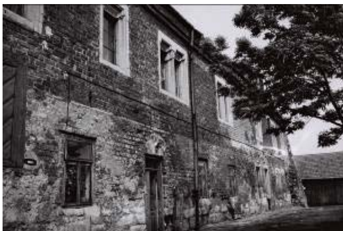
Il. 10. Widok na dom Długosza w latach 60-tych XX wieku.

Ill. 10. View of the House of Długosz in the 1960s.