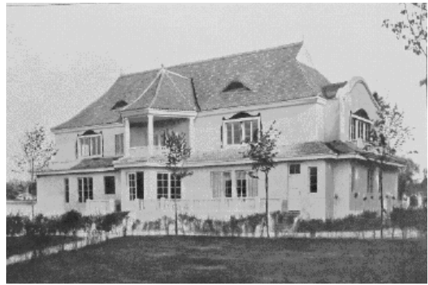
Il. 3. Przykład projektu dworu podmiejskiego, widok z frontu i tyłu, arch. J. Czajkowski, [z:] Wystawa architektury i wnętrz w otoczeniu ogrodowym w Krakowie , MCMXII