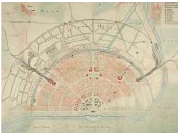
Il. 2. T. Fritsch, Plan eines Zukunft Stadt, [z:] T. Fritsch, op. cit., Leipzig 1896