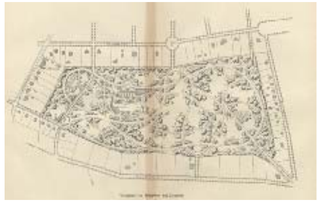
Ill. 1. A. Paris, Monceaux Park, Dresden, b. Blasewitz residential colony, [from:] J. Stübben, op. cit., fig. 835