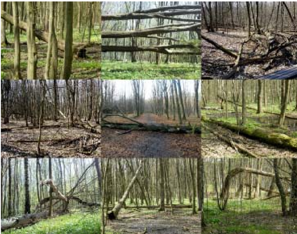
Il. 6 Stan lasu w południowej części Parku Konstytucji 3 Maja