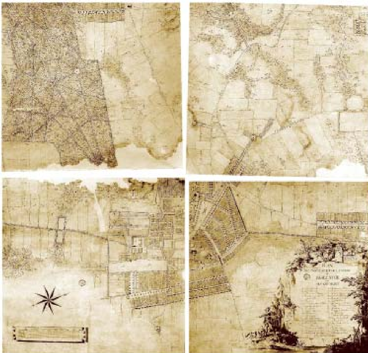
II. 1. „PLAN DU CHATEAU ET DE LA VILLE DE BIALYSTOK AVEC SES ENVIRONS”, druga połowa XVIII w.