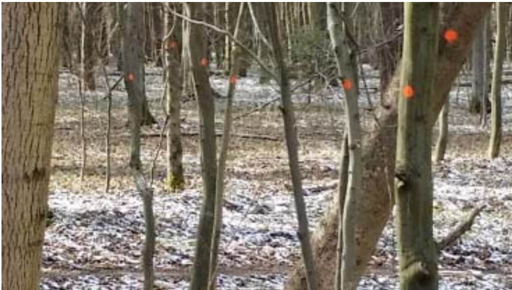
Il. 5. Drzewa do wycięcia na planowanej ścieżce przy pomniku Skarżyńskiego