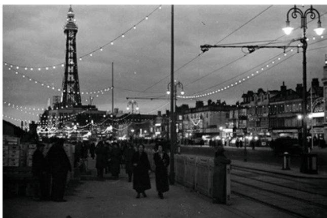
Ill. 1. Golden Mile Promenade in Blackpool in the II half of the 20 th century.