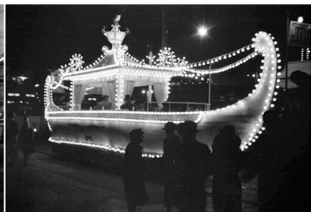
Il. 2. Promenada Golden Mile w Blackpool w I połowie XX wieku.