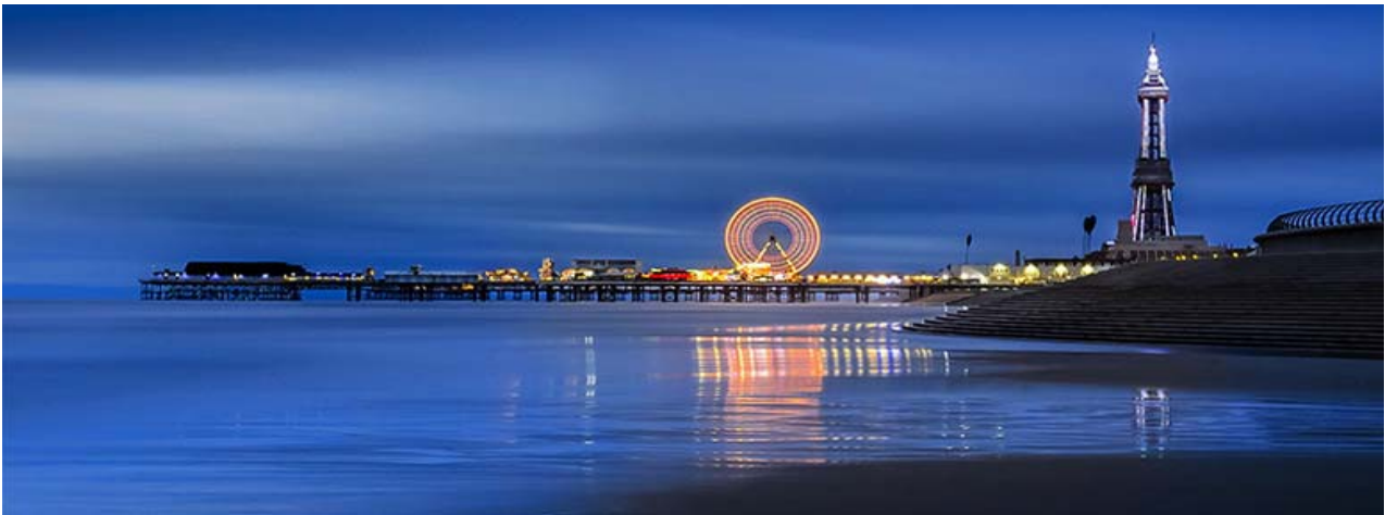
Il. 5. Nocny krajobraz Blackpool. Widok na Pleasure Beach.