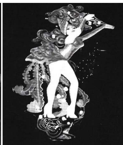
Il. 3. Instalacje świetlne w nurcie Space Age, ok. 1960 roku.