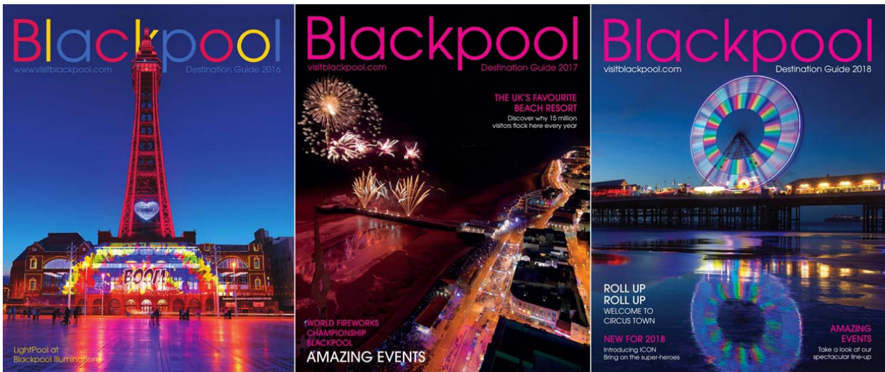
Il. 4. Okładki przewodników turystycznych promujących miasto Blackpool z 2016, 2017 i 2018 roku.

Nocny krajobraz Blackpool pokazuje, że sztukę lumistyczną należałoby traktować w sposób, który umożliwi stworzenie estetyki odpowiadającej miejskiej specyfice. W przypadku brytyjskiego kurortu w owej stylistyce podkreślona została przede wszystkim rola odbiorcy – turysty oraz inwestora, dla których iluminowany krajobraz stał się wytworem kultury konsumpcyjnej, będąc zarówno nośnikiem treści kulturowych, jak i marketingowych.