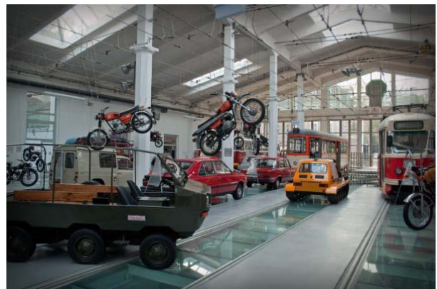
Il. 1. Zajezdnia Sztuki - Muzeum Techniki i Komunikacji w Szczecinie

miono ją jako pierwszą z wszystkich w mieście. Niestety brak remontów i modernizacji spowodował, iż już w 1979 roku obiekt miał niezadawalający stan techniczny i nie był przystosowany do przyjmowania nowego taboru, co w konsekwencji doprowadziło do jego zamknięcia w październiku 2004 roku [12]. Zabiegi na rzecz powstania muzeum w zajezdni, podjęte przez Szczecińskie Towarzystwo Miłośników Komunikacji Miejskiej przy wsparciu Muzeum Narodowego w Szczecinie i Miejskiego Konserwatora Zabytków stosunkowo szybko zakończyły się sukcesem. Obiekt w 2005 roku trafił pod opiekę miłośników komunikacji, dzięki czemu hala byłej zajezdni, jeszcze przed formalnym rozpoczęciem działalności Muzeum Techniki i Komunikacji, które nastąpiło z dniem 1 stycznia 2006 roku, mogła być wykorzystywana do renowacji historycznych pojazdów [13]. Czołowy dziewięcitorowy typ głównej hali zajezdni pozwolił na kreację sali wystawowej o doskonałych cechach ekspozycyjnych dla zabytkowych tramwajów, autobusów, samochodów i motocykli (Il. 1).