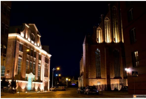
Il. 2. Trafo- Centrum Sztuki Współczesnej w Szczecinie