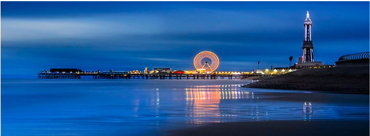
Il. 5. Nocny krajobraz Blackpool. Widok na Pleasure Beach.