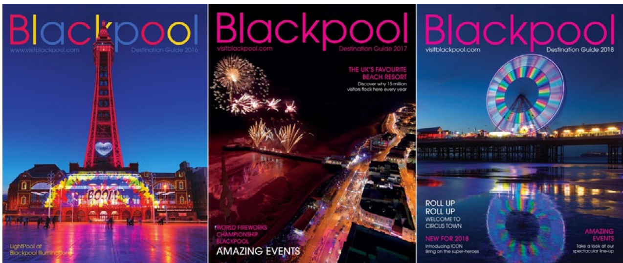
II. 4. Okładki przewodników turystycznych promujących miasto Blackpool z 2016, 2017 i 2018 roku.