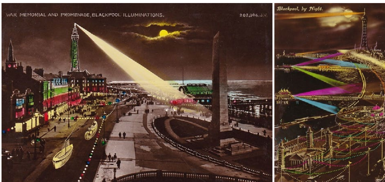
Il. 1. Promenada Golden Mile w Blackpool w II połowie XX wieku. Źródło/source: https://picclick.co.uk/War-memorial-Promenade-The-Illuminations-BLACKPOOL-Lancashire-302946040602.html#&gid=1&pid=1 , dostęp/ acces 2018-11-15