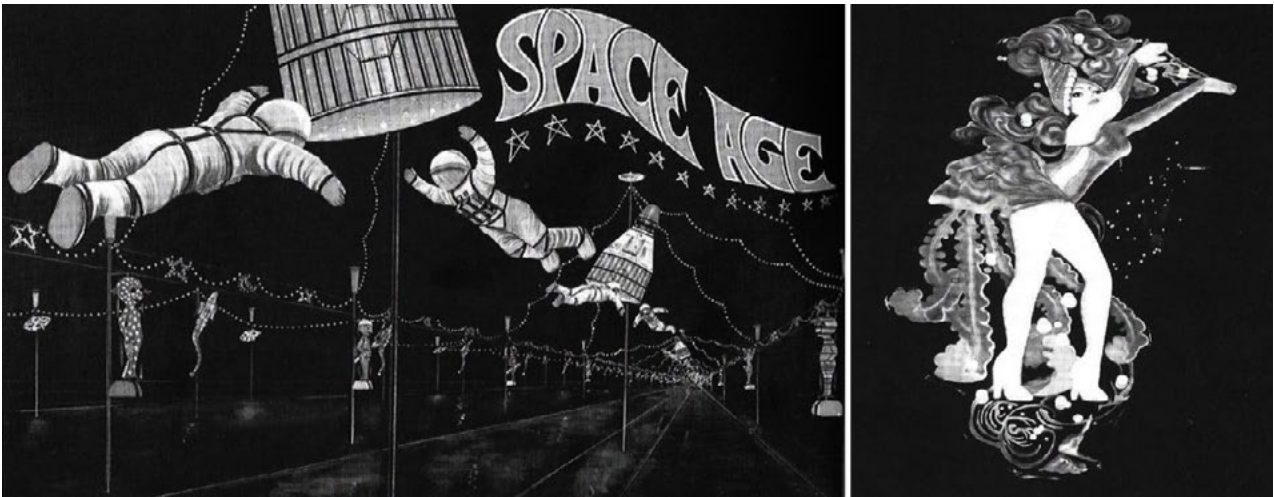
Il. 3. Instalacje świetlne w nurcie Space Age, ok. 1960 roku.