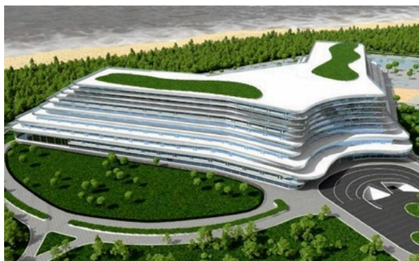
Il. 2. Pobierowo, pięciogwiazdkowy hotel nad morzem dla 2200 osób 1 . Inwestor: T. Gołębiwski.

Podnoszenie standardu wypoczynku – zjawisko związane z ogólnie panującym trendem na podnoszenie jakości świadczonych usług, wynikającym z systematycznie wzrastającej zamożności społeczeństwa, a wraz z nią skłonności do wygodnego wypoczynku. Rosnąca liczba usług i silna konkurencja powoduje wzrost jakości usług turystycznych 19 . Skutkuje to widocznymi w ostatnich latach modernizacjami wielu obiektów, których właściciele starają się nadażyć za potrzebami rynku i wymaganiami rosnącej grupy turystów, chcących wypoczywać w obiektach o wysokim standardzie. W efekcie możemy obserwować coraz większą liczbę ośrodków z ofertą znacznie wykraczającą poza nocleg i wyżywienie, zapewniającą takie udogodnienia jak: kompleksy basenowe, kompleksy wellness i spa, bawialnie dla dzieci, boiska sportowe, dyskoteki, kawiarnie, strzeżony parking i wiele innych. Wszystko zabezpieczone w jednym obiekcie. W efekcie podnoszenia standardu i zapewniania