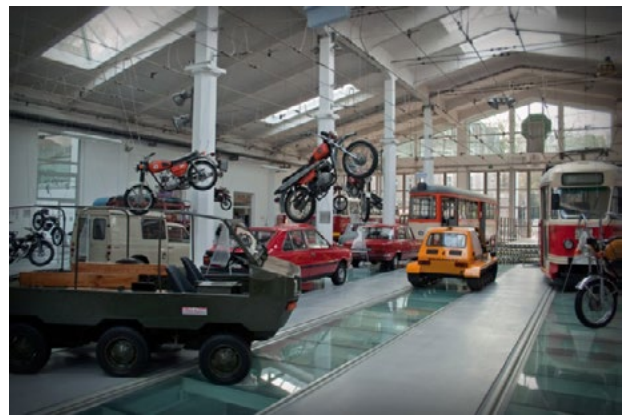
Il. 1. Zajezdnia Sztuki – Muzeum Techniki i Komunikacji w Szczecinie

Pierwotne przeznaczenie gmachu Muzeum Techniki i Komunikacji jest łatwo rozpoznawalne. Umiejscowienie muzeum o wskazanej tematyce w dawnej zajezdni tramwajowej doskonale podkreśla specyfikę obiektu oraz kontynuuje tożsamość miejsca. Budynek zajezdni powstał w duchu modernizmu w 1912 roku według projektu Geорга Steinmetza i Helmutha Griesbacha. Trójnawową bryłę hali zwieńczoną dwuspadowym dachem zdołał całkowicie przeszklony trójkątny fronton z charakterystycznym zegarem. Budynek rozbudowano w 1929 roku, dodając po prawej stronie siostrzaną 5 torową halę, po drugiej zaś niski dwutorowy warsztat o pełnej elewacji [3]. Zajezdnia pełniła swe funkcje nie-