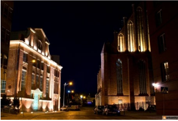
Il. 2. Trafo-Centrum Sztuki Współczesnej w Szczecinie