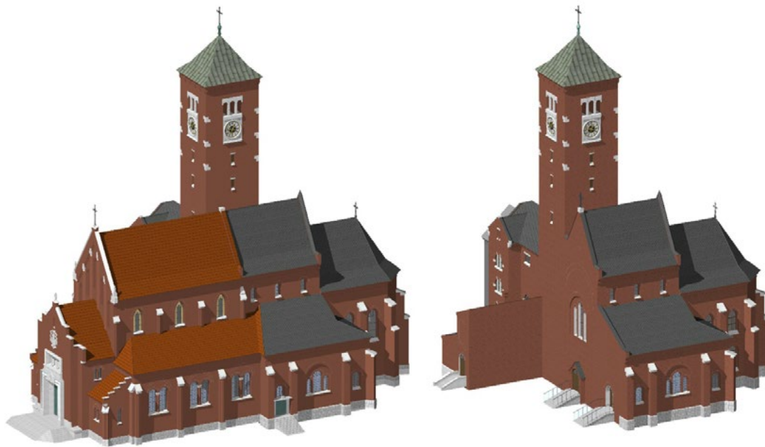
Il. 4. Kraków, kościół Niepokalanego Poczęcia NMP. Z prawej: faza I, 1908–1910, z lewej: faza II, 1929–1933, rys. autor