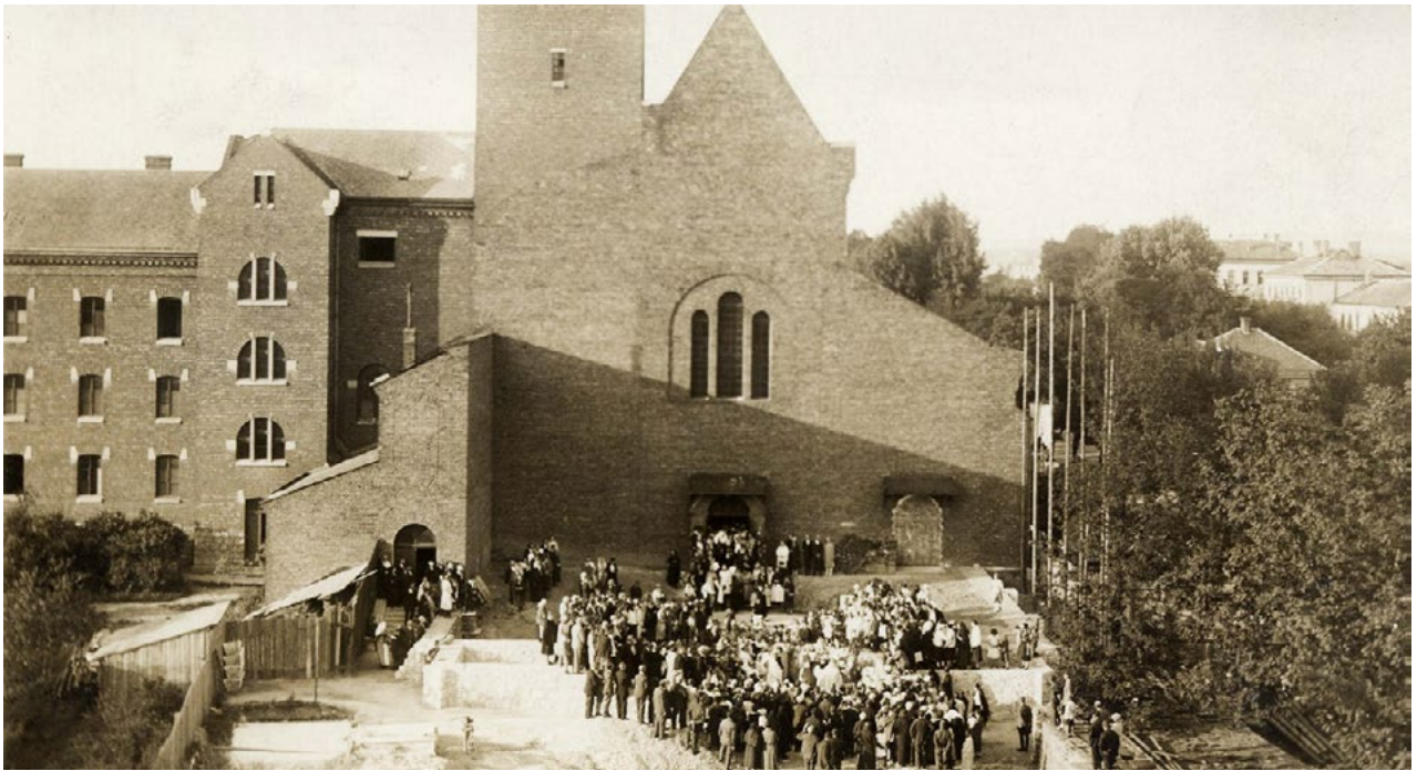
Il. 2. Zdjęcie z uroczystości wmurowania i poświęcenia kamienia węgielnego, 15.08.1929