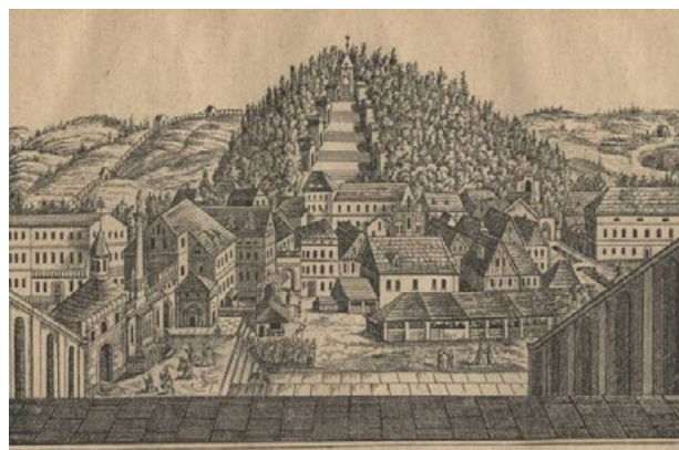
Il. 2. Widok na Kalwarię Wambierzycką z tarasu kościelnego. Ryc. z ok. poł. XIX w. W: A. Hatscher, A. Brauer, Führer durch den Wallfahrtsort Albendorf nebst Beschreibung , Albendorf 1921, s. 18.