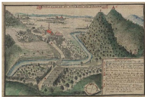
Il. 3. Bardo na rys. F.B. Wenera w poł. XVIII w. Za: F.B. Werner, Topographia seu Compendium Silesiae. Pars II. [...] , (Biblioteka Uniwersytecka we Wrocławiu Oddział Rękopisów, sygn. IVF113b, wol. 2, s. 567).

Wzgórze oplata gęsta sieć stromych dróg i ścieżek przecinających las. Prowadzą nimi trasy pątnicze, przy których stoją kapliczki oraz stacje dróg krzyżowych. Pierwsze z nich wzniesiono w latach 1714–1727, ale zbliżony do pierwotnego kształt zachowały jedynie dwie. Pozostałe powstały w okresie od 1833 do 1839 roku 41 . Dominuje nad nimi barokowa kaplica górska p.w. Najświętszej Marii Panny