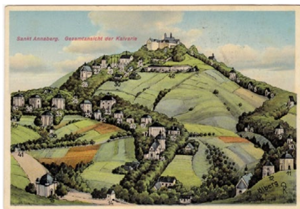
Il. 1. Góra Świętej Anny, pocztówka litograficzna z 2. poł. XIX w.