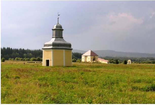
Il. 4. Kalwaria w Krzeszowie, Pałac Heroda (stacja XI), w głębi stacja XII – Dom Schodów i Pałac Piłata. Fot. W. Brzezowski, 2014