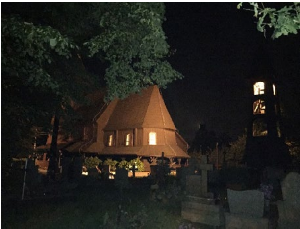
Il. 1. Oświetlenie kościoła parafialnego pw. Św. Barbary, dzwonnicy oraz cmentarza we wsi Góra.