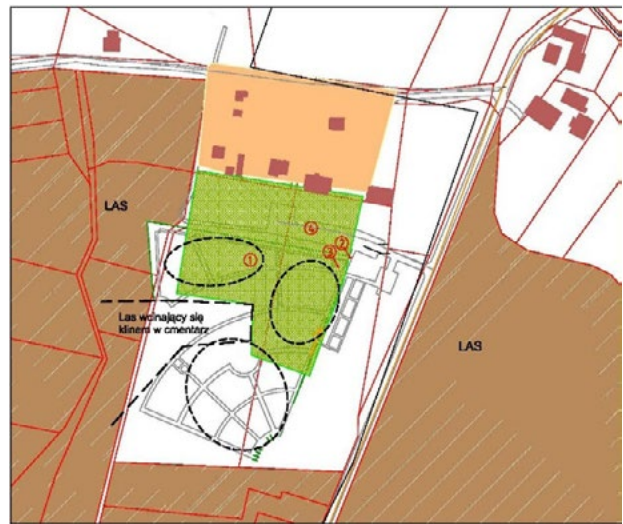
Il. 6. Schemat cmentarza komunalnego w Tychach (opracowanie G. Lasek) Legenda: 1. cmentarz; 2. brama wejściowo-wjazdowa na cmentarz; 3. krzyż; 4. parking

Ostatnim prezentowanym miejscem pochówku jest cmentarz komunalny w Tychach przy ulicy Barwnej założony na przedmieściach na przełomie XX i XXI wieku. Otoczony jest lasami pszczyńskimi. Dostępny jest od strony wschodniej, poprzez zjazd z drogi prowadzonej wzdłuż nekropolii. W sąsiedztwie głównej bramy wejściowo-wjazdowej zrealizowano parking. Miejsce lokalizacji nie posiada kontekstu sakralnego. Działka nekropolii wpisuje się w kształt nieregularnego prostokąta, w który – w sposób centralny – klinem wbija się niewielki las. Układ ścieżek zakomponowano w kształt wachlarza. Wydzielono w ten sposób kwatery na nagrobki. Niestety miejsce, w którym zbiegają się główne dojścia nie pokrywa się z lokalizacją głównej strefy wejściowej. Niepodkreślony dominantą punkt kulminacyjny dla układu ścieżek tworzących wachlarz znajduje się po przeciwnej stronie głównej strefy wejściowej. Zarazem obydwie zlokalizowane są w narożnikach wschodniej granicy parceli. W obrębie głównej strefy wejściowej zlokalizowano krzyż.