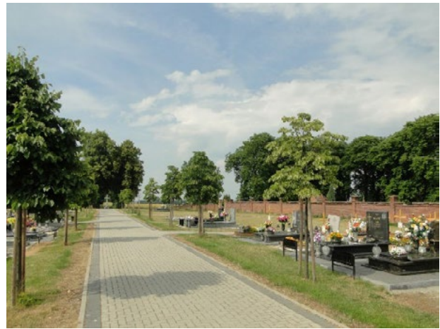
Il. 3. Widok cmentarza w Złotogłowicach. Jedna z głównych alej widoczna w całości. Druga aleja, zlokalizowana za murem rozdzielającym działkę, zaakcentowana jest układem drzew

Nekropolia położona jest na uboczu, za linią zabudowań i ogrodów przydomowych. Dostęp zapewniają drogi dojazdowe oraz ciąg pieszo – jezdny prowadzony od placu przykościelnego, wzdłuż działki przeznaczonej na funkcje sakralne i świeckie. W rozwiązaniu