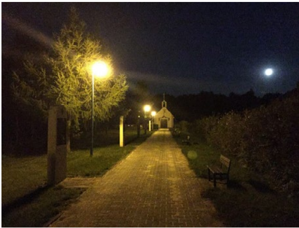
Il. 5. Widok oświetlenia prowadzącej na cmentarz alei, stacji drogi krzyżowej oraz kaplicy w Ławkach

Il. 5. The view of cemetery lane illumination, Stations of the Way of the Cross and a chapel in Lawki