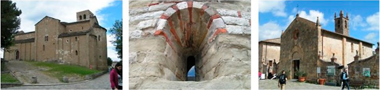
Il. 11, 12, 13. Romańskie kościoły typu pieve w Toskanii, San Leo i Monteriggioni (z prawej). Fot. Anna Mitkowska, 2017