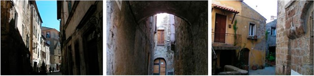
Il. 8, 9, 10. „Wnętrza” krajobrazów miasteczka Pitigliano w Toskanii. Fot. Anna Mitkowska, 2017