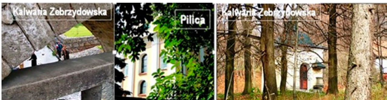
Il. 5, 6, 7. Okna (z lewej i w środku) i przeźrocze widokowe (z prawej). Wybrane przykłady uformowań sztucznych (budowlanych) i przyrodniczych (roślinność). Fot. Anna Mitkowska, 2004, 2005 (Pilica)

rozrzeźbionych lub w rozlewiskach wód integralnie zespały się z lokalnym podłożem tworząc nieskończone liczby obiektów o charakterze organicznym i malowniczym. Poczynając od XIII wieku, wraz z rozpowszechnianiem się postaw franciszkańskiego umiłowania przyrody i rozwijającą się stopniowo estetyką zmierzającą do renesansu, rezydencje, miasta i ogrody coraz częściej zaczynały otwierać się na przyrodę i doceniać jej piękno.