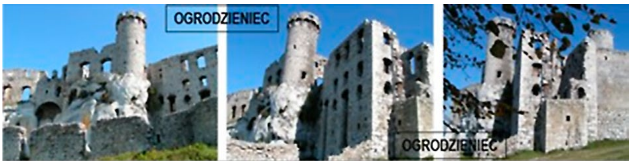
Il. 1, 2, 3. Ruiny zamku w Ogrodzieńcu, Jura Krakowsko-Częstochowska. Fot. Anna Mitkowska, 2007