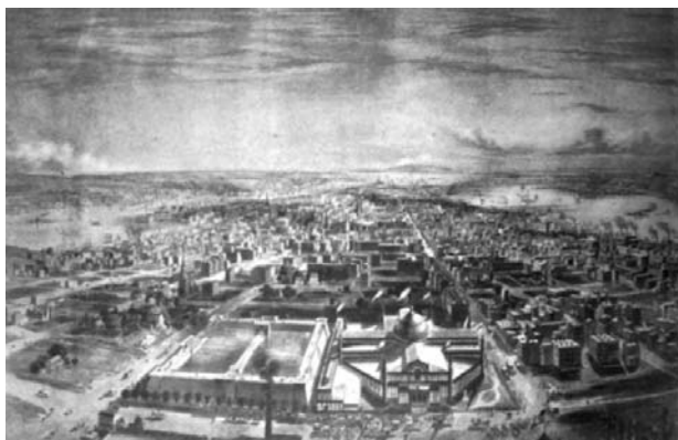
Il. 1. Widok na Manhattan z Latting Observatory, 1855.

Ale zanim powstał Central Park, na wysokości 42. Ulicy, do której sięgało ówczesne miasto, zorganizowano w 1853 roku wystawę światową. Na terenie dwóch bloków „siatki” wzniesiono dwie imponujące konstrukcje — pawilon wystawowy, zbudowany na planie krzyża i zwieńczony gigantyczną kopułą, wzorowaną na londyńskim Cristal Palace (Mattie, 1998) oraz drewnianą, o niemal stumetrowej wysokości wieżę Latting Observatory,