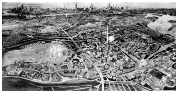
II. 3. Wystawa nowojorska 1939 — „anti-Manhattan”. Widok terenów Expo w kontekście miasta i panoramy Manhattanu.

Schemat organizacyjny wystawy obejmował centralną arterię komunikacyjną Constitution Mall, między budynkami New York City Building (proj. A. Embury II) i United States Building (proj. H. L. Cheney) oraz pozostałe aleje rozchodzące się promieniście z Centrum Tematycznego. Dzieliły one cały obszar na siedem stref — rozrywki, komunikacji, interesów społecznych, żywności, rządu, produkcji i dystrybucji, i transportu — posiadających własne hale wystawowe. Kolorystyka schematu podkreślała kompozycję urbanistyczną i strefowanie funkcjonalne — od jasnych kolorów w centrum do ciemniejszych odcieni na peryferiach (Schiavo, 2010). Aby uzyskać atrakcyjne powiązania widokowe w szerszej skali i wyeksponować widoczny w oddali skyline Manhattanu, obiekty wystawowe