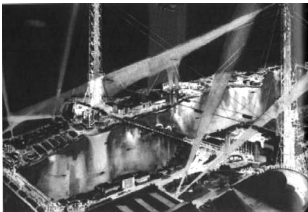
Il. 9. Podniebna Przejazdka — główna atrakcja rozrywkowa Chicagowskiej Wystawy Wieku Postępu 1933.

Planowaną początkowo główną atrakcją w postaci gigantycznej wieży zastąpiła Podniebna Przejazdka — Sky Ride (proj. J. d'Esposito) — kolejka linowa, rozpięta pomiędzy dwoma wieżami usytuowanymi na lądzie i na Northerly Island, przewożąca w opływowych gondolach 'rocket cars' zwiedzających na wysokości 210 stóp, nagradzając ich odwagę spektakularnymi widokami terenów wystawowych i panoramą miasta (Mattie, 1998).