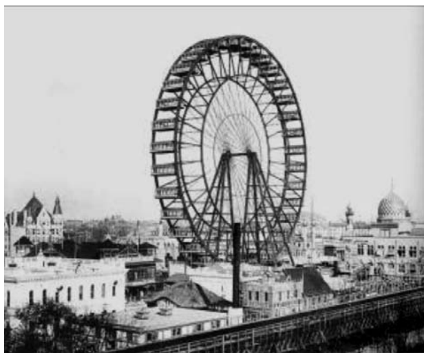
Il. 8. Koło Ferrisa górujące nad strefą rozrywki Midway Plaisance na Wystawie Kolumbijskiej w Chicago w 1893.