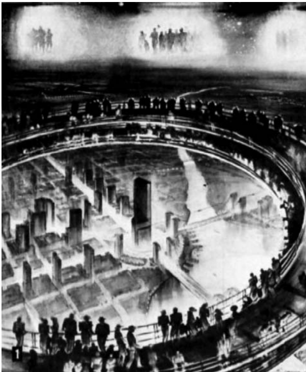
Il. 5. Futurystyczna koncepcja „Nowego Jorku Jutra” prezentowana w Futuramie .

Ill. 5. The futuristic concept of “New York of Tomorrow” presented at Futurama .