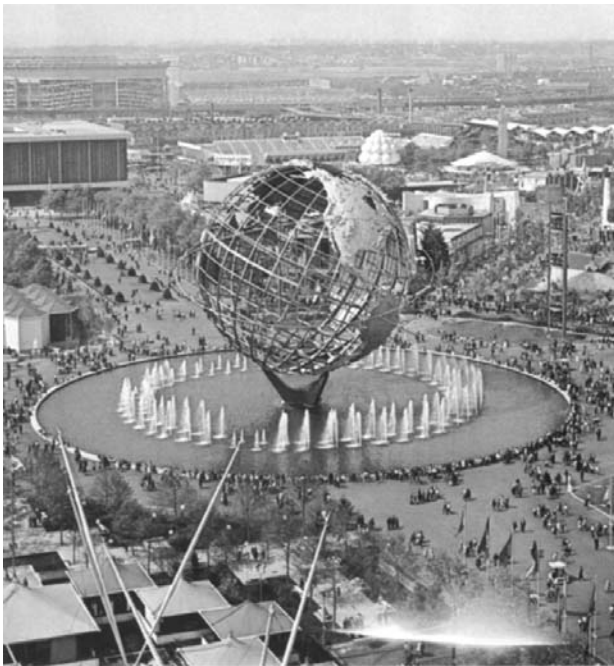
Il. 6. Wystawa Nowojorska 1964. Symbol Expo — Unisphere — w centrum terenów wystawowych.