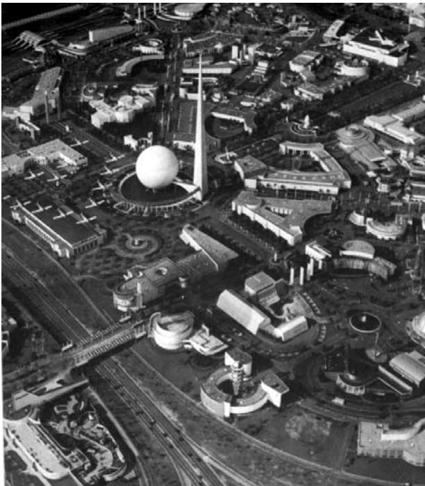
Il. 4. Centrum Tematyczne wystawy nowojorskiej z 1939 roku z Trylonem i Perysferą.