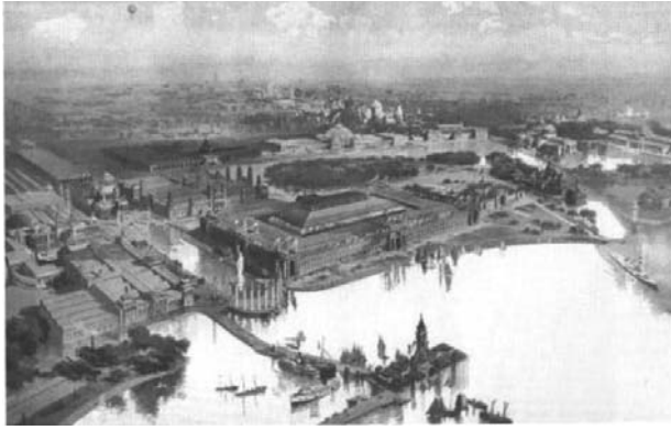
Il. 7. Wystawa Kolumbijska w Chicago w 1893 roku. Widok terenów wystawowych od strony jeziora Michigan.