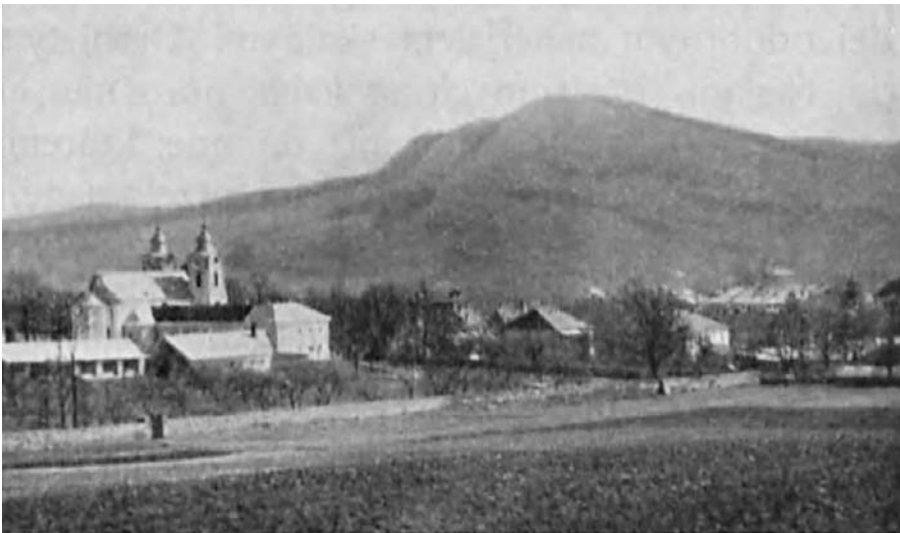
Il. 7. Widok na kościół i klasztor oo. Bernardynów od strony północno-zachodniej w latach trzydziestych XX wieku.