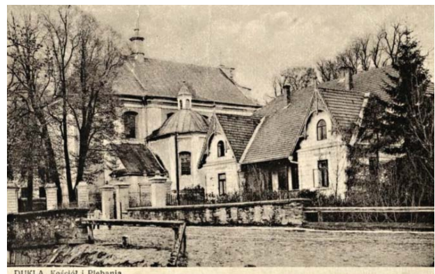
II. 4. Kościół parafialny pw. św. Marii Magdaleny oraz plebania w pierwszej połowie XX wieku na archiwalnej pocztówce. Kopia pocztówki [w:] Archiwum Katedry HAUiSzP WA PK.

te, rokokowe wyposażenie wnętrza. Na jej sklepieniu znajduje się polichromia przedstawiająca sceny z życia i śmierci św. Marii Magdaleny. Wiadomo, że twórcami wyposażenia kościoła byli rzeźbiarze lwowscy (Łopatkiewicz i Łopatkiewicz, 2005, s. 25). Ołtarz zdobią między innymi rzeźby prezentujące Chrystusa oraz Marię Magdalenę. Znajdują się tutaj również rzeźby alegoryczne, które przedstawiają cztery postacie symbolizujące: wiarę, nadzieję, miłość i pokutę, a także bogato zdobione tabernakulum. W kaplicach bocznych, na ścianach, znajdują