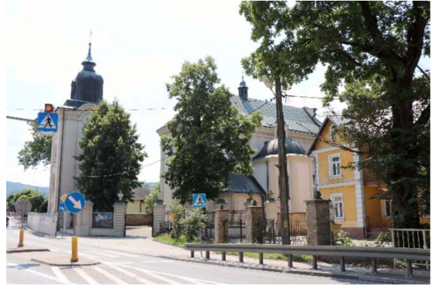
Il. 6. Kościół parafialny pw. św. Marii Magdaleny w Dukli obecnie. Widok od strony północno-wschodniej.

Projektant kościoła nie jest znany. Być może był nim nadworny architekt rodziny Mniszchów