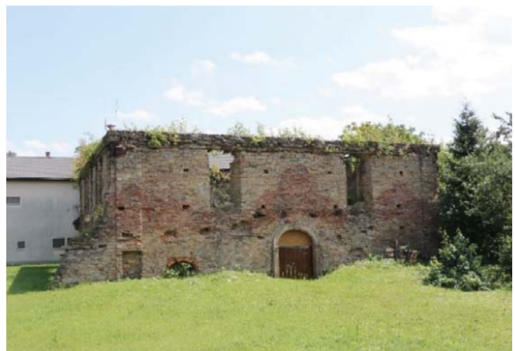
Il. 12. Ruiny synagogi w Dukli obecnie. Widok od strony południowej (fot. D. Kuśnierz-Krupa, 2018).