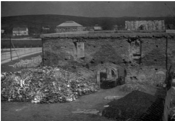
Il. 10. Synagoga w Dukli, ruiny po II wojnie światowej (fot. [w:] Archiwum Katedry HAUiSzP WA PK).

Ostatnim z analizowanych obiektów sakralnych miasta jest synagoga, przypominająca o żydowskim dziedzictwie kulturowym Podkarpacia. Pierwsi Żydzi zamieszkali w Dukli na przełomie XVI i XVII wieku. Ich głównym zajęciem stał się handel węgierskim