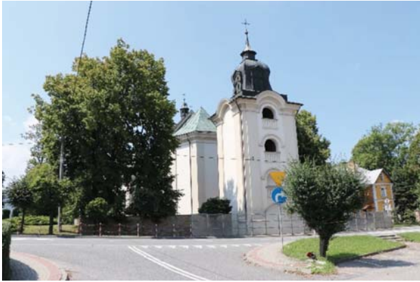
Il. 5. Kościół parafialny pw. św. Marii Magdaleny w Dukli obecnie. Widok od strony południowo-wschodniej.

Ill. 5. Parish church of St. Mary Magdalene in Dukla nowadays. View from the south-east.