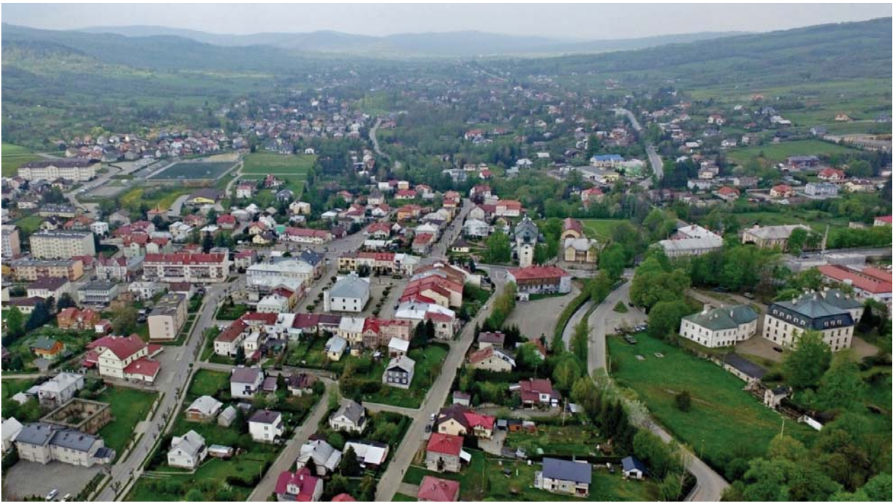
II. 2. Widok z lotu ptaka na Duklę.