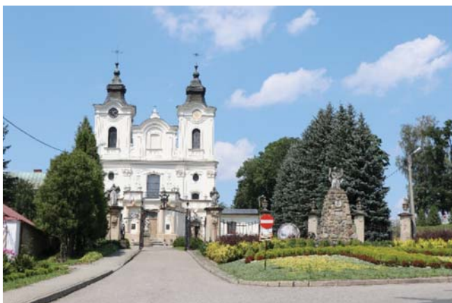
Il. 8. Zespół kościelno-klasztorny oo. Bernardynów w Dukli obecnie. Widok od strony południowej.