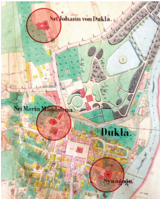
II. 3. Zabytki sakralne miasta zaznaczone na planie katastralnym Dukli z 1851 roku.