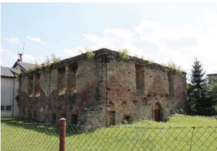
Il. 11. Ruiny synagogi w Dukli obecnie. Widok od strony południowo-zachodniej (fot. D. Kuśnierz-Krupa, 2018).

Obecny obiekt, a właściwie jego ruiny, pozbawione dachu, pochodzą z drugiej połowy XVIII wieku i znajdują się przy ulicy Cergowskiej. Zbudowano go z kamienia polnego i cegły, na planie kwadratu. Synagoga jest piętrowa, wejście od zachodu zwieńczone jest archiwoltą z kluczem. Na południowej ścianie znajdują się hebrajskie inskrypcje. W trakcie II wojny światowej synagoga została zdewastowana przez hitlerowców. Do naszych czasów przetrwały