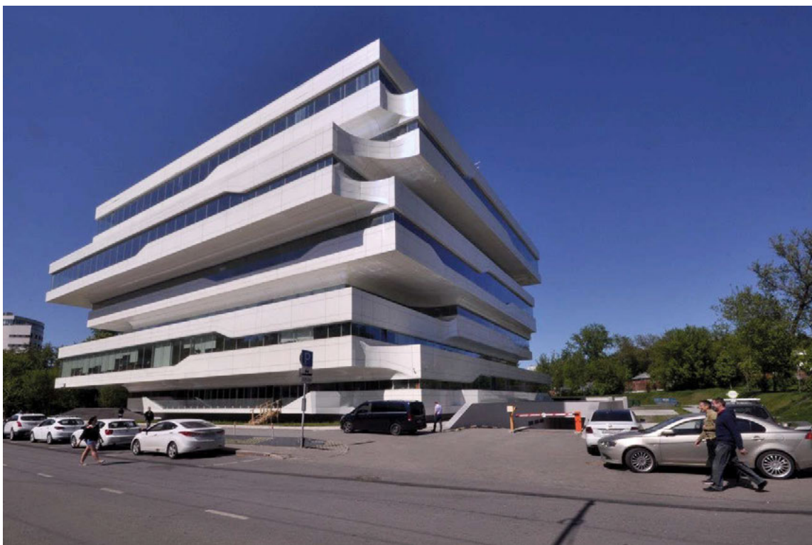
II. 1. Gmach budynku Dominion Tower prezentuje wysokiej jakości architekturę oraz dbałość o detal.