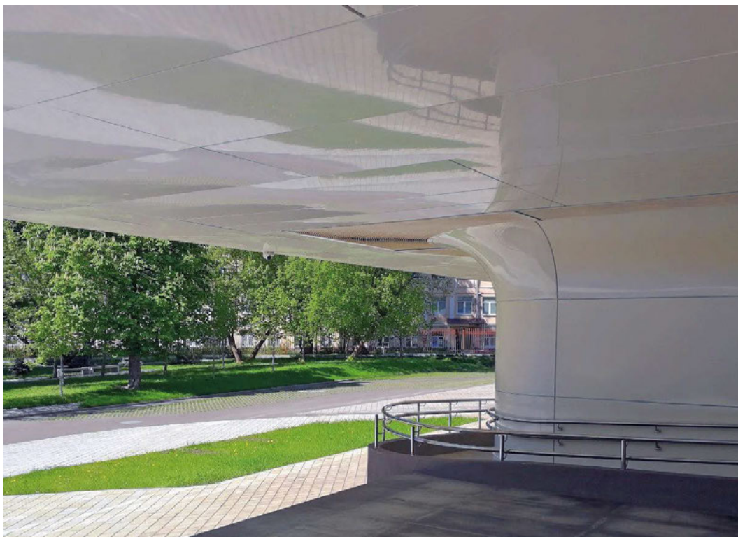
Il. 4. Dbłość o detale i połączenie widokowe obiektu z naturą świadczą o wysokiej jakości rozwiązaniach architektonicznych (fot. W. Duliński).

Source: https://www.archdaily.com/774364/ , (accessed: 21.02.2020)