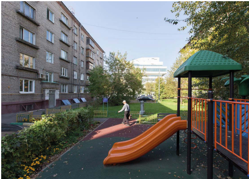
Il. 3. Dominion Tower jako zamknięcie widokowe perspektywy.