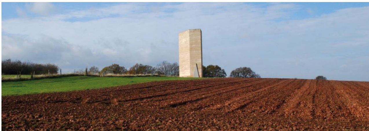
II. 4. Kaplica Brata Klausa w krajobrazie, Wachendorf, Niemcy, arch. Peter Zumthor, 2007.