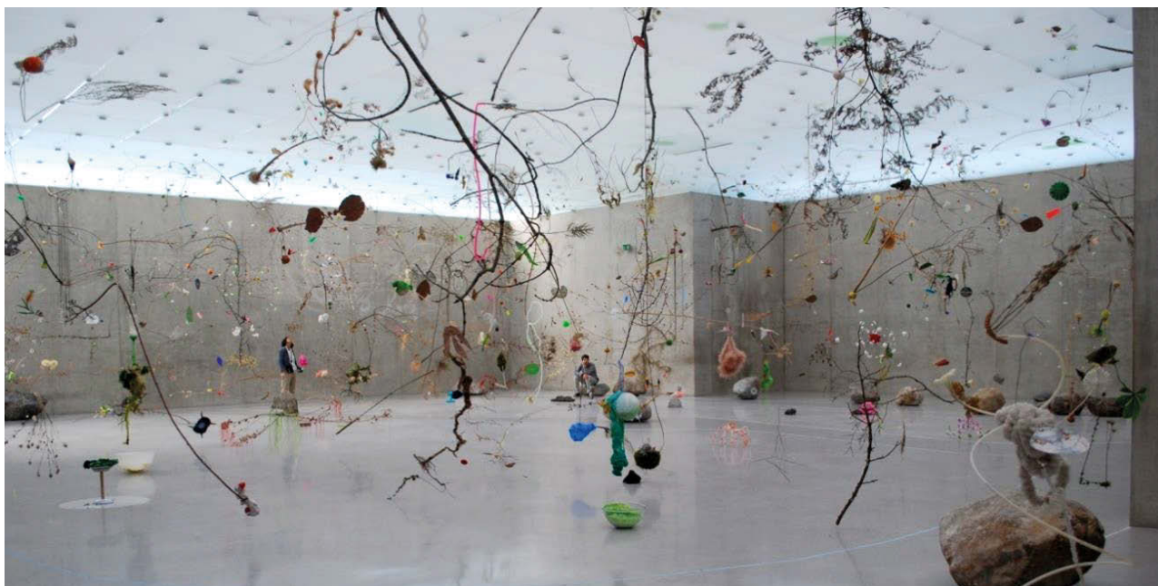
II. 1. Kunsthhaus Bregenz, Austria, arch. Peter Zumthor, 1997; dzieło: Gerda Steiner i Jürg Lenzlinger: 'Lungenkraut', 2017.

W teorii atmosfery autorka sytuuje badania własne w nurcie związanym z praktyką edukacyjną i projektową. Przedstawione badania, niezależnie od różnic między nimi, humanizują metody analizy wnętrz architektonicznych i miejskich zarówno zrealizowanych, jak i projektowanych. Większość stawianych pytań dotyczy odbioru atmosfery, a nie jej budowania: (kwestia zmienności w czasie lub zakotwiczenia atmosfery w pierwszym wrażeniu, kwestia niespójności lub niedopasowania między percepcją a zaangażowaniem afektywnym człowieka), stanowiąc przedmiot neuronauki i psychologii. Osiągnięcia tych nauk adaptują do edukacji architektonicznej badacze młodej generacji, ale też Mallgrave i Pallasmaa (Canepa i in., 2019, par. 13). Dla praktyki edukacyjnej i projektowej istotne są dwa wnioski: wzmocnienie zaufania do metod posługujących się opisem otoczenia, których podstawą jest intuicja i związek między językiem a doświadczeniami przestrzennymi, cielesnymi i afektywnymi (De Matteis i in., 2019, par. 9) oraz przypomnienie roli scenograficznych aspektów architektury w budowaniu jej atmosfery: (...) sztuka scenografii staje się paradygmatem dla głównych koncepcji teorii atmosfery: rodzajów atmosfer (postaci), ich quasi-objektywności, to znaczy tworzenia atmosfer, emocjonalnych treści (Böhme, 2013b, streszczenie).