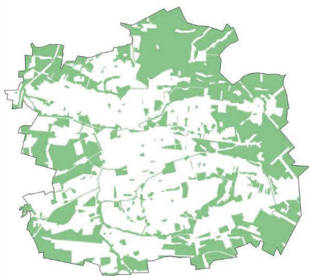
Il. 2. Łódź — struktura przyrodnicza. Na podstawie Studium uwarunkowań i kierunków zagospodarowania przestrzennego 2018, (oprac. graf. A. Winiarska).