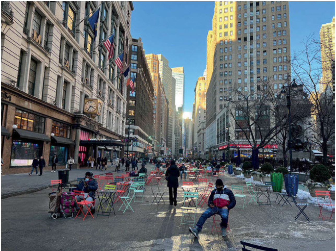
III. 12. Pedestrian zone at Broadway closed to vehicle traffic.