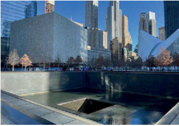
Ill. 3. The closed fountain and deserted 9/11 Memorial Park.