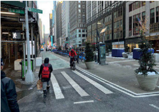
Ill. 5. Bicycle path and Citi Bike station on Broadway.