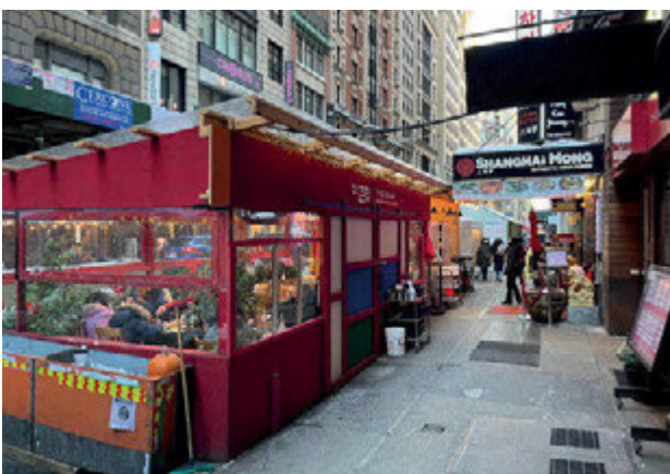
Ill. 7. Temporary dining sheds, Koreatown, Manhattan, 8.01.2022.