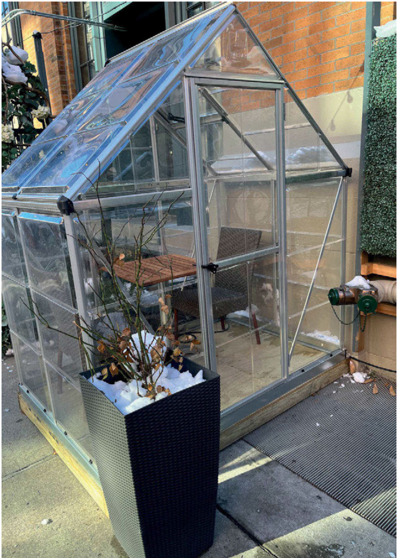
III. 9. Two-person's table sidewalk shed, Manhattan.