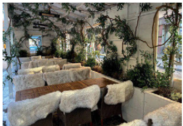
Ill. 8. Interior of a restaurant's temporary dining shed, Manhattan.