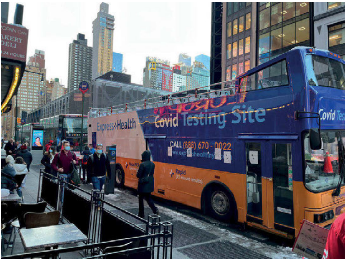
III. 11. Mobile test point for COVID-19, Manhattan.