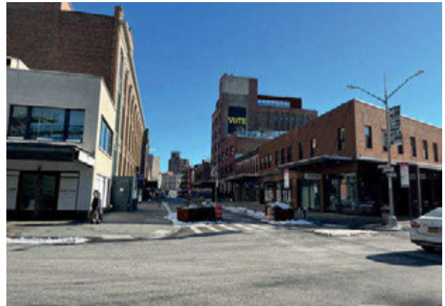
Ill. 6. Little West 12 Street at Lower Manhattan, transformed into the so-called 'Open Street', with limited access to cars.