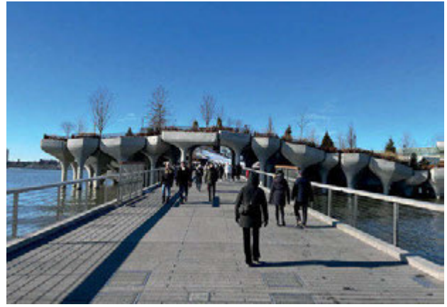
Ill. 4. Little Island, new waterfront park in Manhattan.