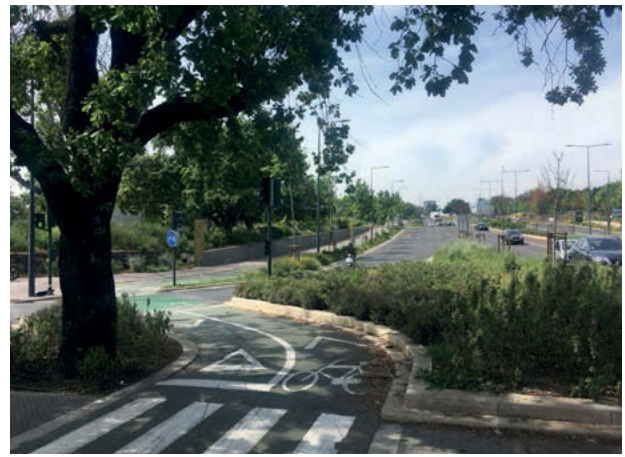
III. 3. Greening along traffic arteries as part of the city's rainwater retention and tree planting programs. Left: Av. De 24 Julho, right: new bike lanes, Pç. De Espanha.