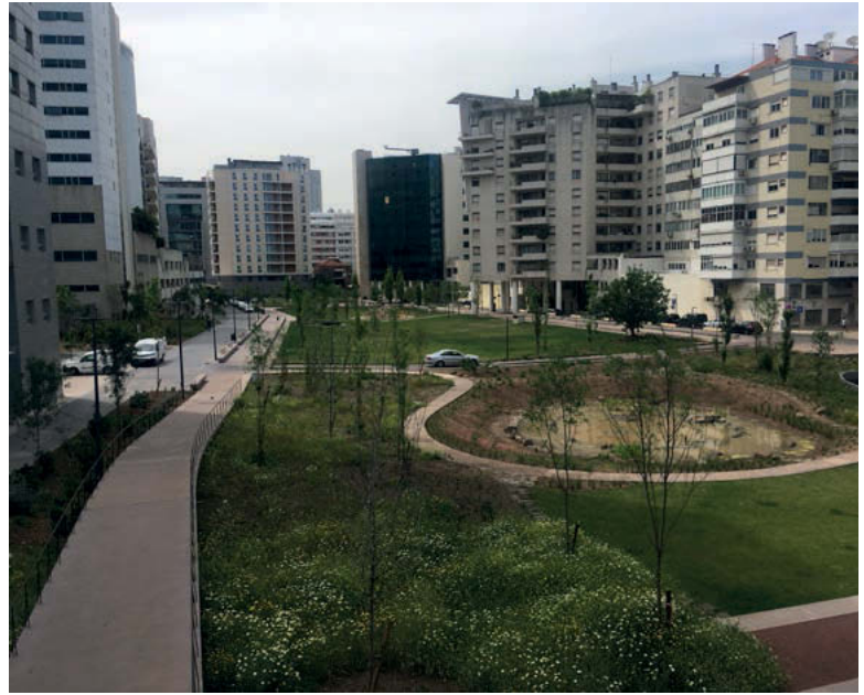
III. 1. Parc Gonçalo Ribeiro Telles — a rain garden between Pç de Espanha and Rua Eduardo Malta (Urban Park). Photo by N. Przesmycka, 2022.