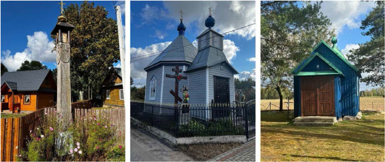
Ill. 5. A pillar shrine in the village of Klejniki, a house shrine in the village of Kojły, a shrine by a spring in the village of Kuraszewo.