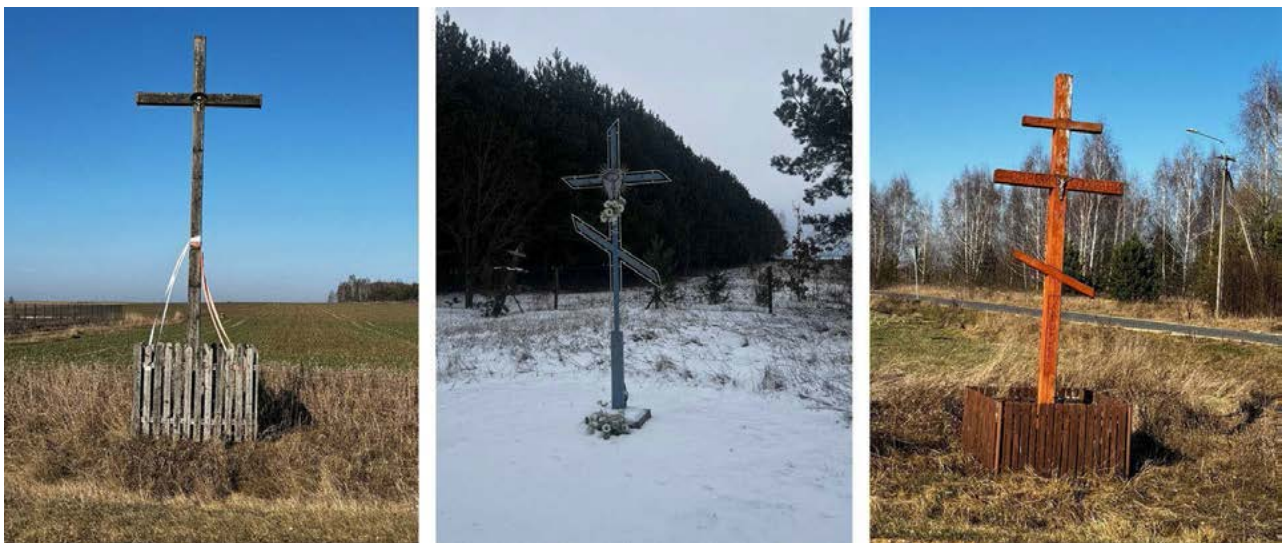
Ill. 2. Types of crosses found in the space of border villages: four-armed (Lady), six-armed (Morze), eight-armed (Kuraszewo).