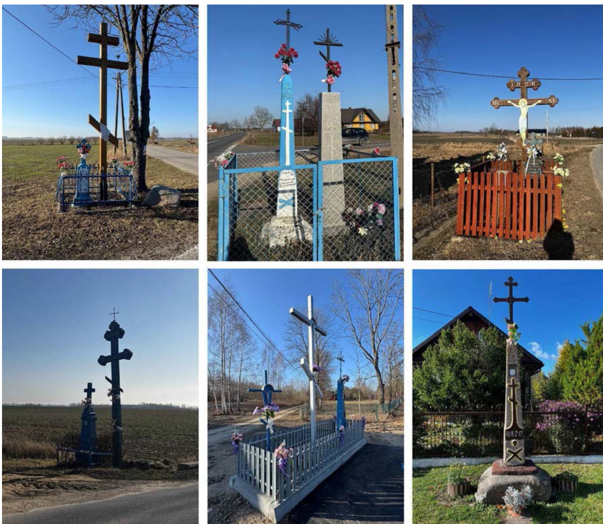
III. 4. Groups of roadside crosses in the villages of 1. Szostakowo, 2. Czyże, 3. Osówka, 4-5. Zbucz; 6. a house cross in the village of Czyże.