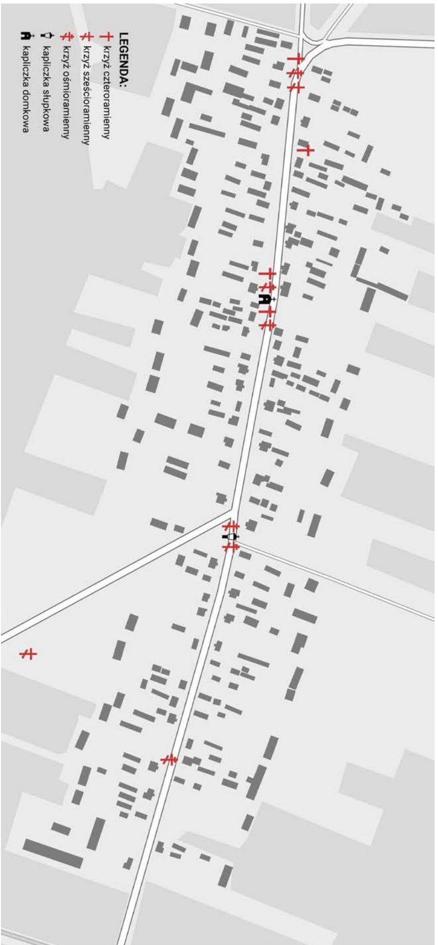
Il. 7. Arrangement of crosses and shrines in the landscape of the village of Kołty.