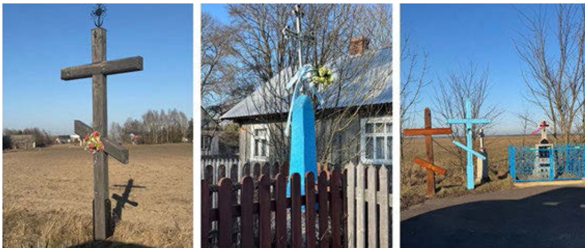
III. 3. Materials used in the construction of roadside crosses: wooden cross in the village of Kojły, stone-iron cross in the village of Podrzeczany, group of crosses in the village of Kamień.