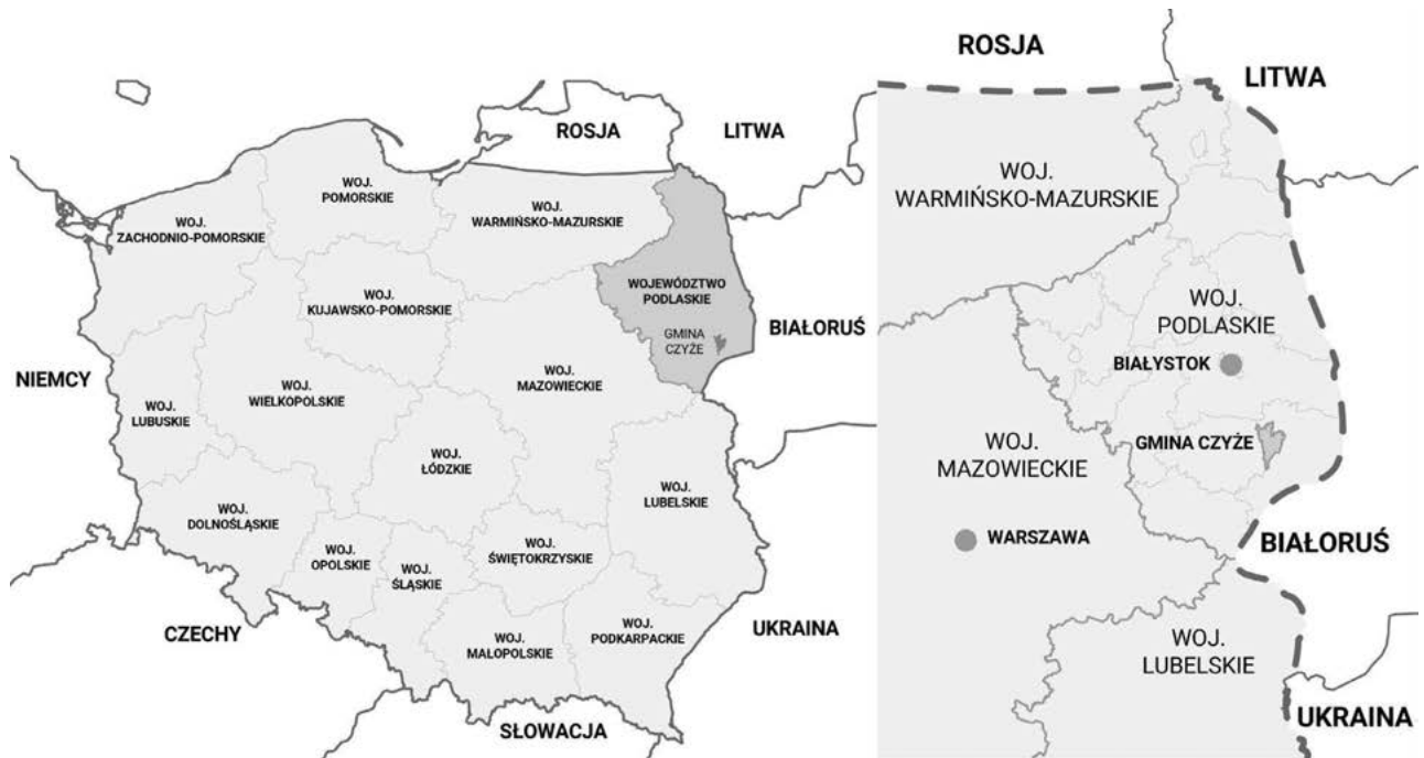
Ill. 1. Location of the study area in the administrative borders of Poland and in Podlaskie Voivodeship.